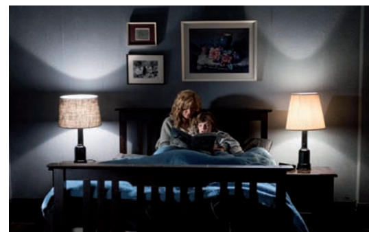
Una scena del film Babadook

to, getta una luce inaspettata, quasi conciliante, su tutta la storia. Per il resto si ondeggia tra la trita commedia italiana con Raul Bova in Torno indietro e cam-