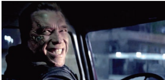
Una scena del film Terminator Genesys

A nche se i cinema sono ancora aperti, le programmazioni risentono delle proposte tipiche dell'estate. Mentre continua la presenza sugli schermi dei dinosauri di Jurassic World, tra le novità recenti si segnalano Ted 2, il ritorno del pupazzo, alter ego del protagonista omonimo, e l'ennesimo