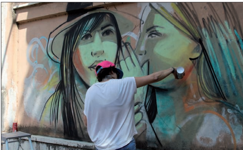
La street art di Alice Pasquini

zatori. L'Associazione Tutti i colori del libro è riuscita infatti nel suo intento di riempire Piazza Vittorio Veneto, dal 26 al 28 giugno, di scrittori e di spettato-