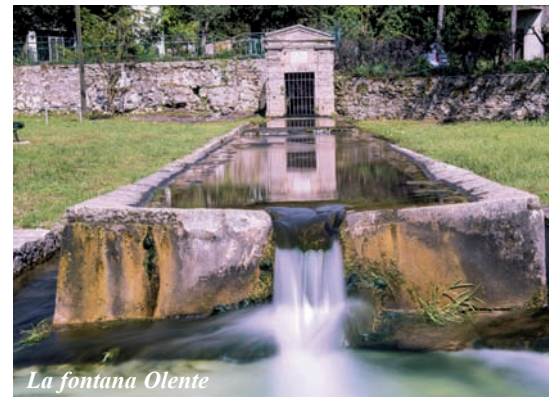
La fontana Olente